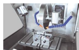
試料ステージの様子