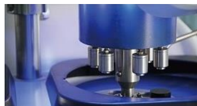
LEDブルーライト搭載