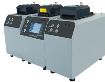
3基組み合わせた例