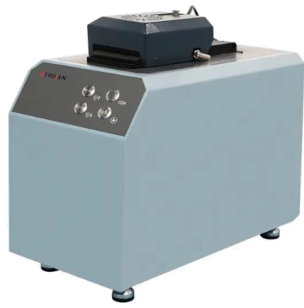
OSK 97UO FL2 拡張ユニット