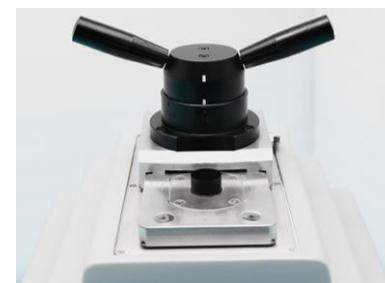
使いやすいスライド式開閉構