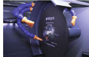
太径で給水の冷却機構