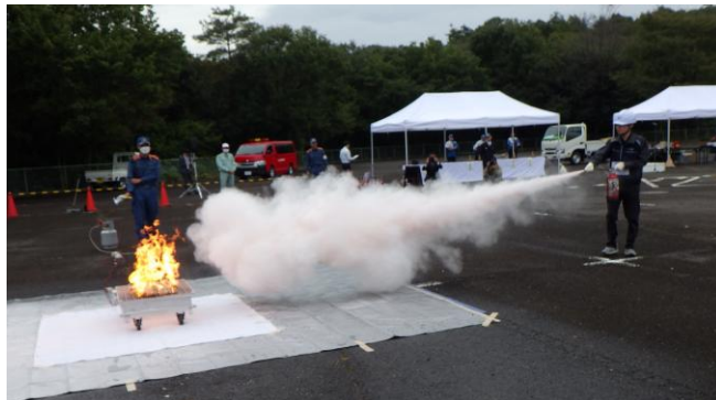
2024年10月30日 愛知県 犬山市危険物防火安全協会 消火技術競技会消火器部門 2