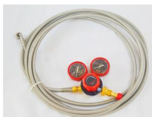
専用レギュレータ※6、 専用ガスホース