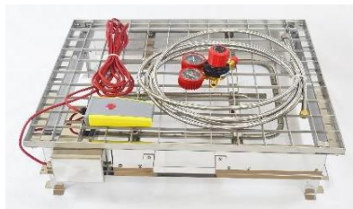
OSK 97UM 01 消火訓練