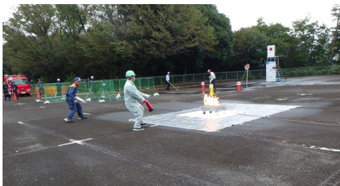
2024年10月30日 愛知県 犬山市危険物防火安全協会 消火技術競技会消火器部門 1