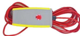
ワイヤードリモコン