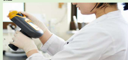
大量サンプルの迅速な分析、研究開発ラボでのばらつきのない実験