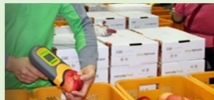
包装工場とサプライチェーンのためのポストハーベスト品質検査