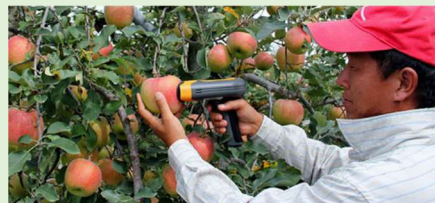
生産者のための収穫前熟度判定