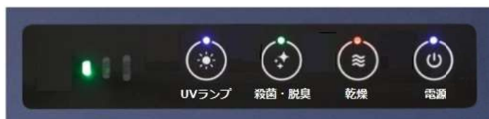
表示画面（紫外線・除菌・乾燥のそれぞれの機能を個別にON/OFF可能）