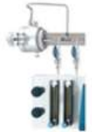
左：標準 右：オプション（1個追加）