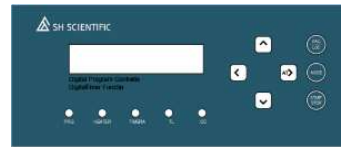
プログラマブルコントローラ