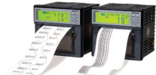
2CHハイブリッドレコーダー