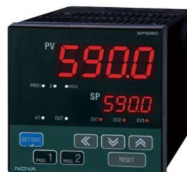
プログラマブルコントローラ