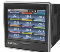
デジタルレコーダー