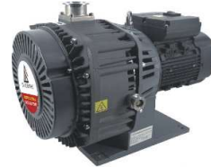
オイルフリー真空ポンプ付