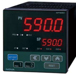
プログラマブルコントローラ