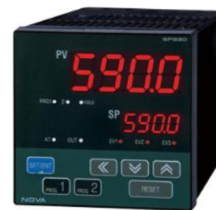
プログラマブルコントローラ