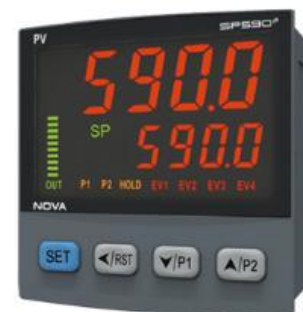
プログラマブルコントローラ