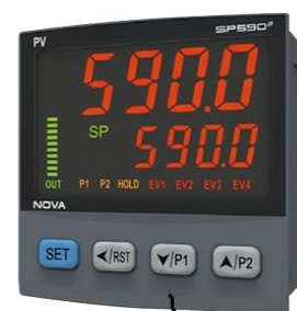
プログラマブルコントローラ