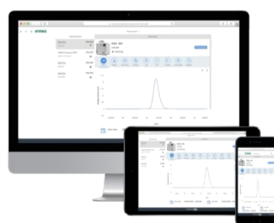
VELP Ermesクラウドによる遠隔監視