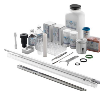
スタートアップ用キット（A00000193）