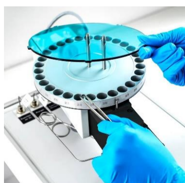
サンプルディスク1枚