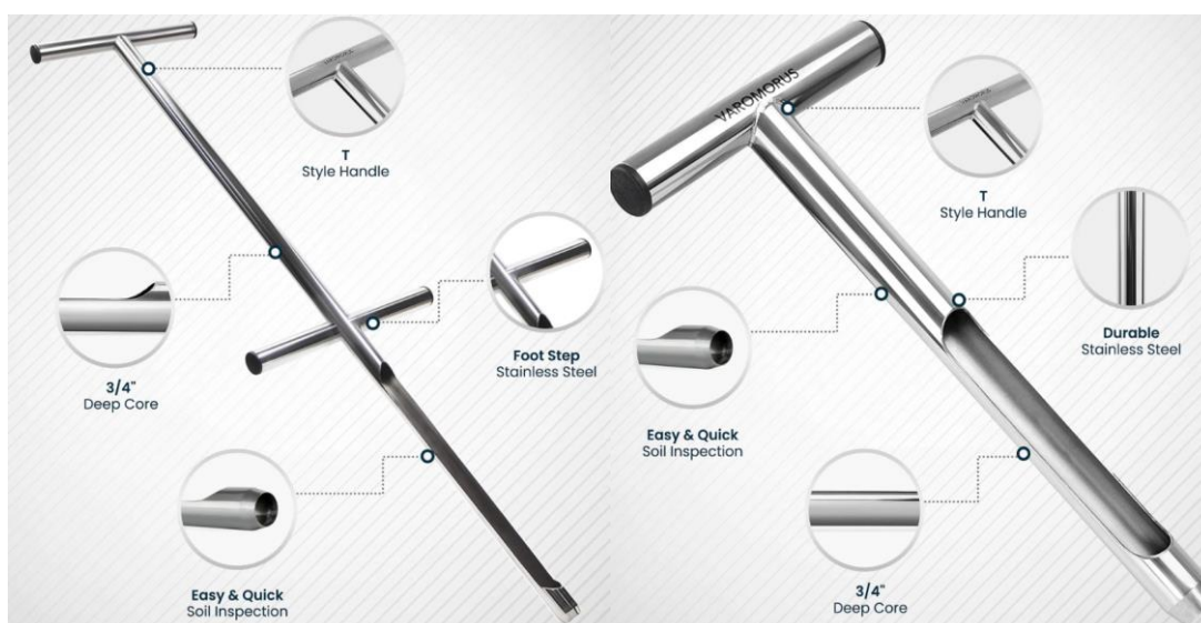
ハンドル、鋭い先端部、フットステップ