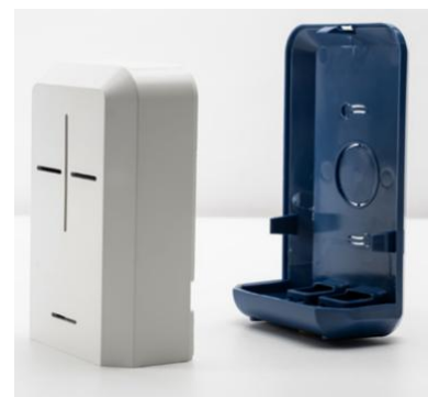
カートリッジ交換式

また、空気質の評価をスマートフォン上でも5段階の色で表示することができます。 センサーカートリッジを交換するだけでメンテナンスおよび較正が最適化。