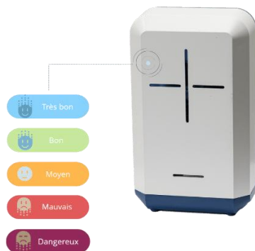
ランプの色で状況を表示