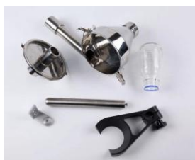
サイクロン分離機パーツ