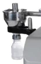
サイクロン分離機