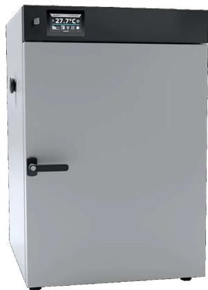
OSK 23ND129-CLN180 粉体塗装鋼板