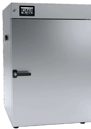
OSK 23ND129-CLN180 ステンレススチール リネン仕上げ