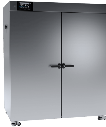
OSK 23ND106-SLW750 ステンレススチール仕上げ