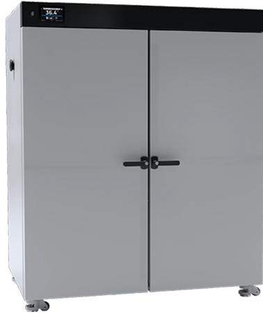
OSK 23ND106-SLW750 粉体塗装鋼板