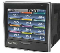
デジタルレコーダー