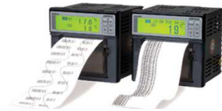
2CHハイブリッドレコーダー