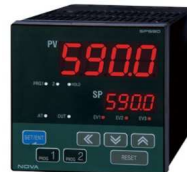
プログラマブルコントローラ