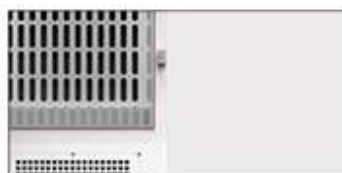
ドアシーリングガスケット