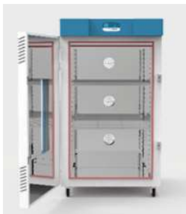
OSK 93TI311-546 内部