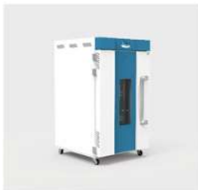
OSK 93TI311-360 側面