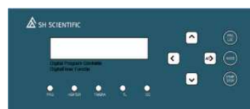
プログラマブルコントローラ