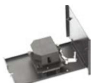
鏡面反射アクセサリ