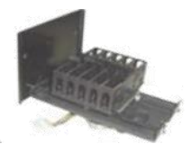
ユニバーサル 5 ポジション 5-50mm 光路長電動セルホルダー