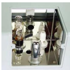
タングステンランプおよび重水素ランプ