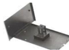
角度調整可能 固体サンプルホルダー