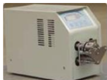
シッパポンプアクセサリ (ポンプ、チューブ、カセット、フロントパネル、フローセル)