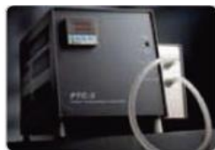
ペルチェモジュール