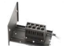
8 ポジション 10mm 光路長電動セルホルダー