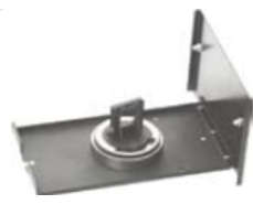
溶解アクセサリ (16ポートPVDFマニホールドアセンブリ、16×1/4-28-M6チューブセット)

* オプション品の中には本体ご購入の際にご注文いただく必要のあるものもございますので、予めご相談ください。