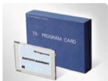
プログラムカード (DNA・タンパク質分析、定量測定、測光測定、多波長分析)