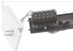
5ポジション10mm恒温セルチェンジャー