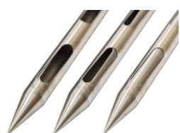
二重組合せ構造と先端