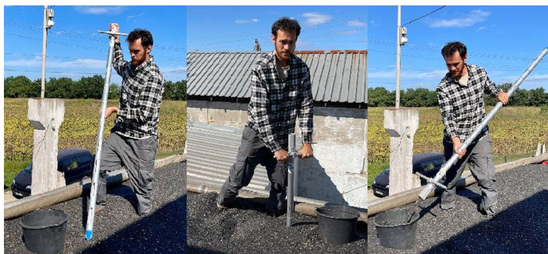
ヒマワリの種をサンプリングの際の実景