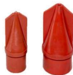
プラスチック製先端チップ