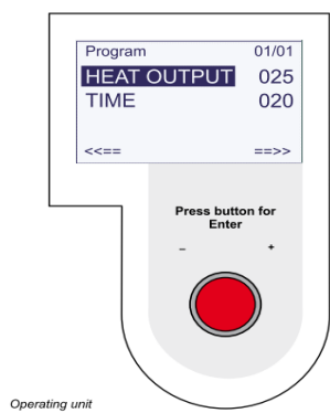
使いやすい操作パネル