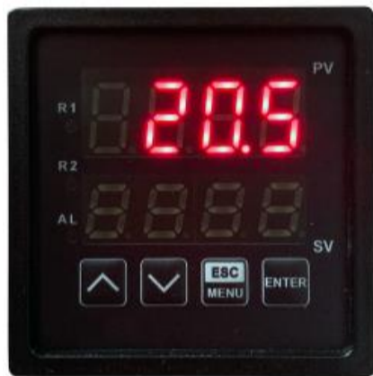
Simple - プレビュー画面