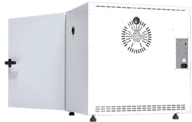
OSK 23ND107-SLW115 背面