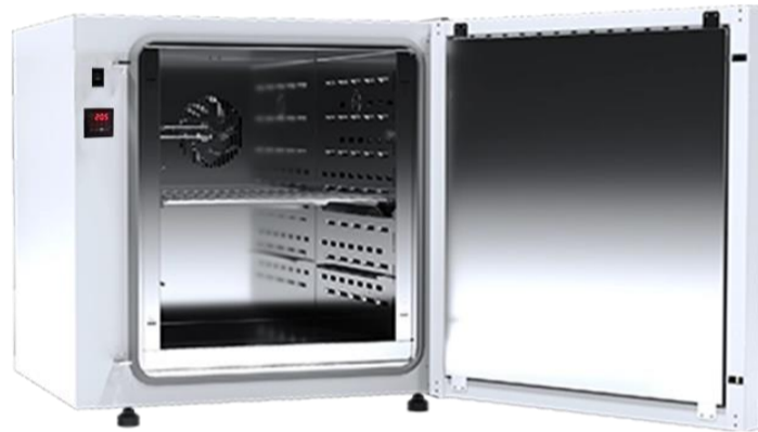
OSK 23ND107-SLW115 前面ドア開放時