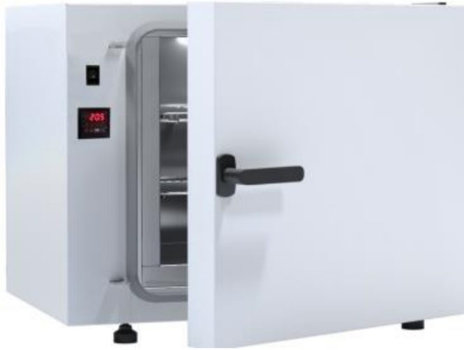
OSK 23ND107-SLN53 粉体塗装鋼板