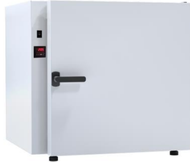
OSK 23ND107-SLN115 粉体塗装鋼板