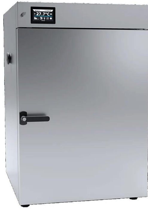
OSK 23ND102-SLW180 ステンレススチール リネン仕上げ