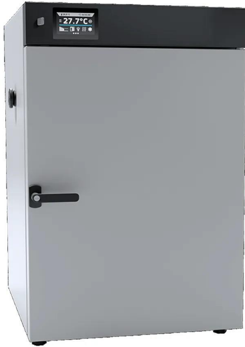
OSK 23ND102-SLW180 粉体塗装鋼板