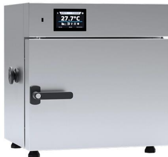
OSK 23ND100-SLW15 ステンレススチール リネン仕上げ