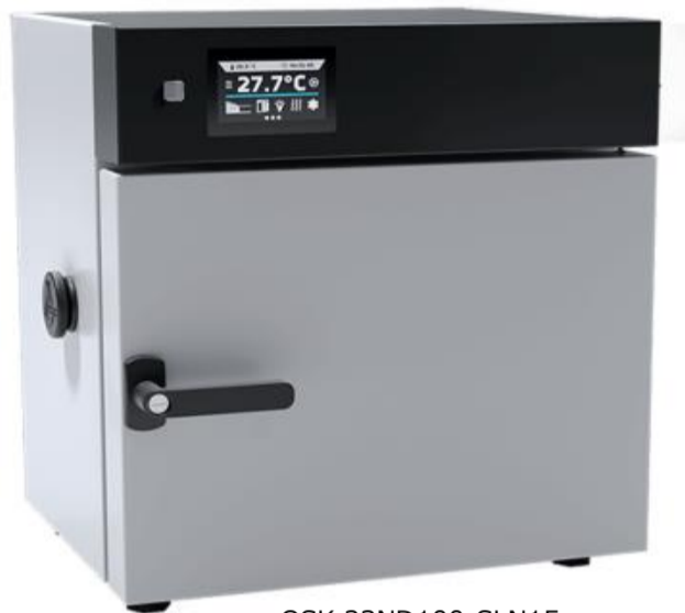
OSK 23ND100-SLN15 粉体塗装鋼板 Smart - プレビュー画面